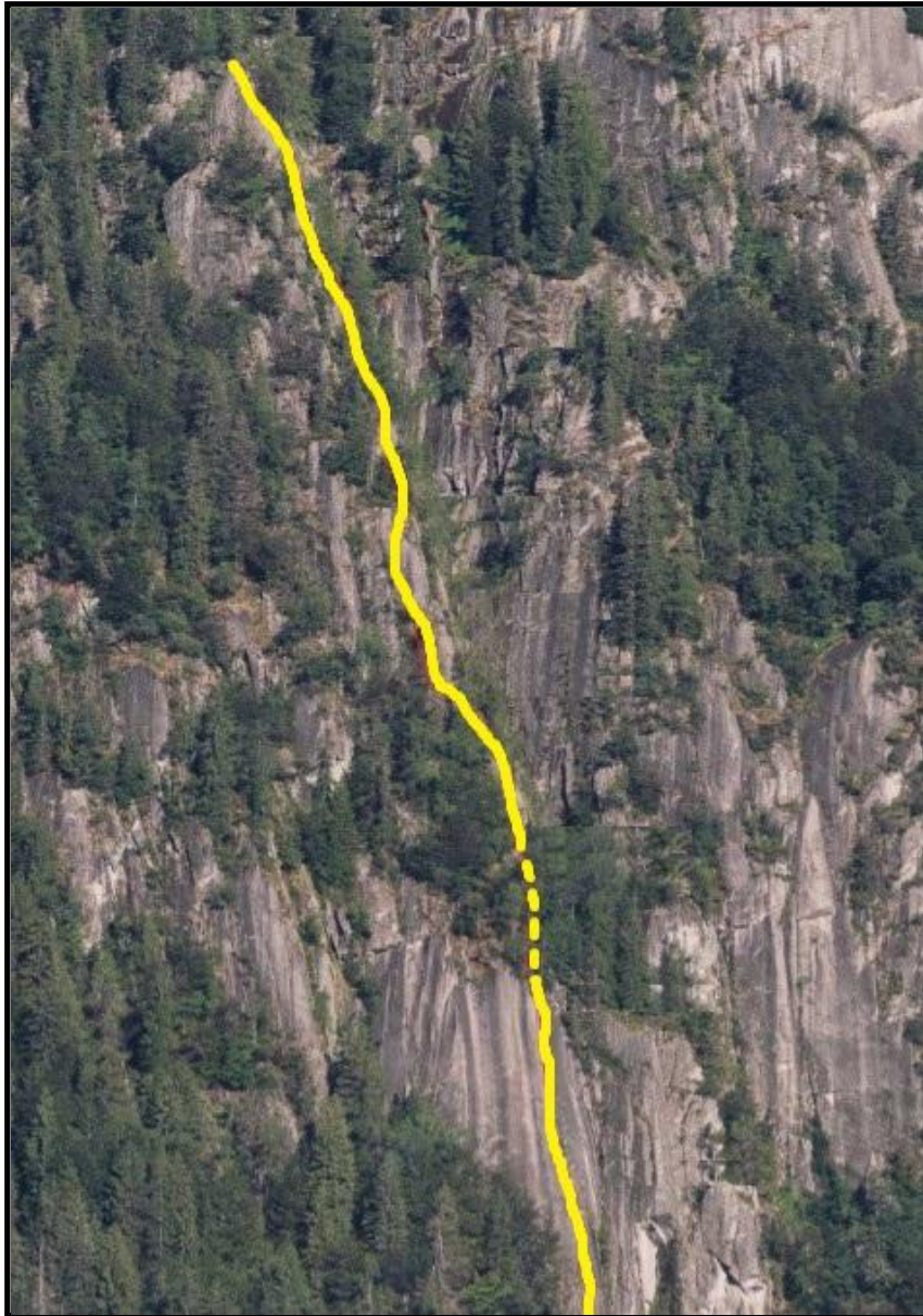
In GIALLO il tracciato di "King line"